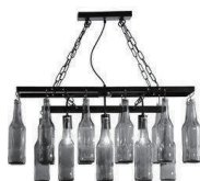
(例)ブラケットカバーがバー型